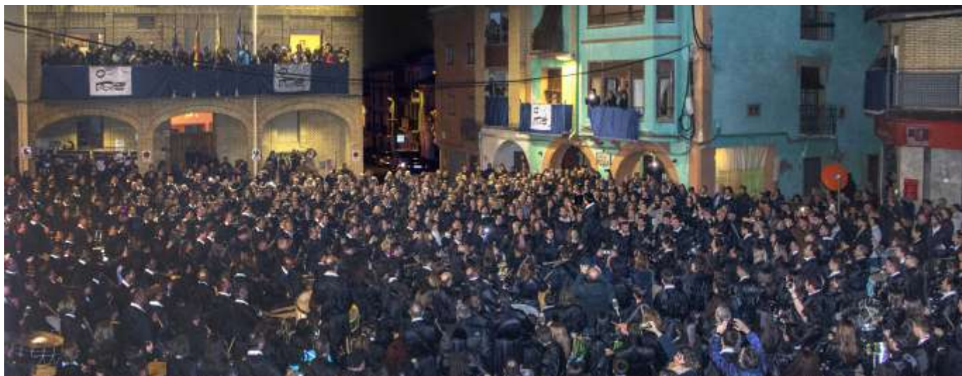
Cese del toque 2018

Mejoras en maquinaria auxiliar y medios. Para reforzar los trabajos de la patrulla municipal, se ha adquirido una podadora neumática, carretillo-sulfatadora de 100 litros, cortacésped, ahoyadora, grupo eléctrico y tijeras varias.