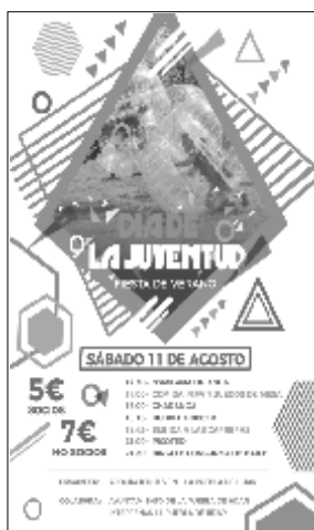
Día de la Juventud