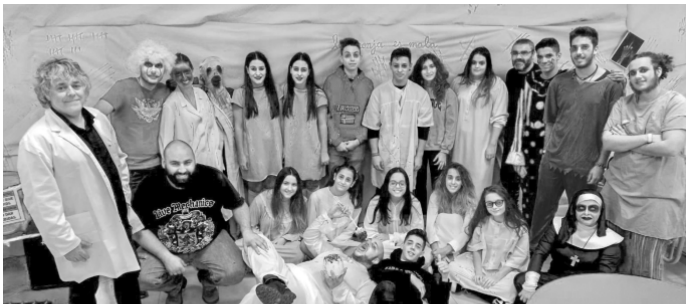
Hallowenn - Casa del Terror

celebración de Halloween, abanderó uno de los actos más valorados del año en La Puebla. Se volcaron en hacer un túnel del terror muy real en el edificio de la Ludoteca, con muchísima afluencia de público que tuvo que hacer largas colas. La valoración general fue muy positiva y el trabajo desarrollado espectacular.