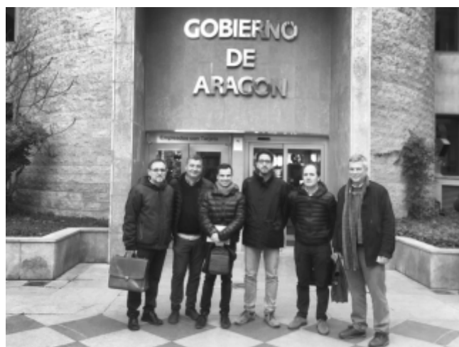
El alabastro como filtro de purines