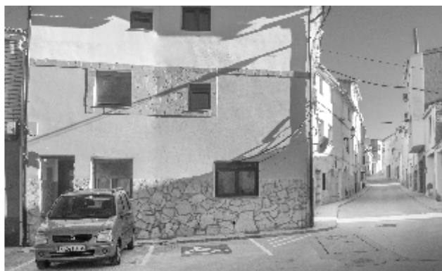
Plaza de Minusvalido

Ampliación calzada A-1406. Ya se publicaron las expropiaciones para la ampliación de calzada de la carretera A-1406 que une La Puebla e Híjar y que llegará en un principio hasta las Tres Marías. Ahora el tramo duplicado actual va desde La Puebla hasta la Torre La Sorda, con lo que con esta ampliación quedaría sólo pendiente de realizar el último kilómetro hasta Híjar.