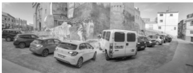
Parking Plaza de la Iglesia

Parking Plaza de la Iglesia. A final de año se adquiere por 62.000 € este amplio espacio formado por 4 solares que suman 500 m 2 . Se hacía fundamental para la creación de zonas de aparcamiento céntrico, pues se encuentran a poca distancia de bares, tiendas, peluquerías, entidades bancarias y ayuntamiento. Como intervención urgente se ha consolidado y embellecido el muro, se ha nivelado el suelo y compactado con zahorra y se han anulado las aceras, uniendo el solar a la calle. Quedaría pendiente una actuación definitiva en muro y solera, una vez urbanizado y con las líneas de distribución de plazas pintadas, podrían aparcar un mínimo de 20 coches. La adquisición del solar permitirá una mejor circulación y sanear un espacio fundamental del casco viejo.