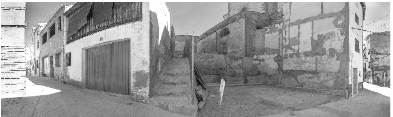
Saneamiento Casco Viejo. Calle San Roque