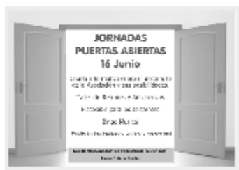
Jornada Puertas Abiertas Jubilados

Tercera edad. Además de la actividad habitual de la Asociación, se mantiene el servicio de monitor, que durante unas horas a la semana