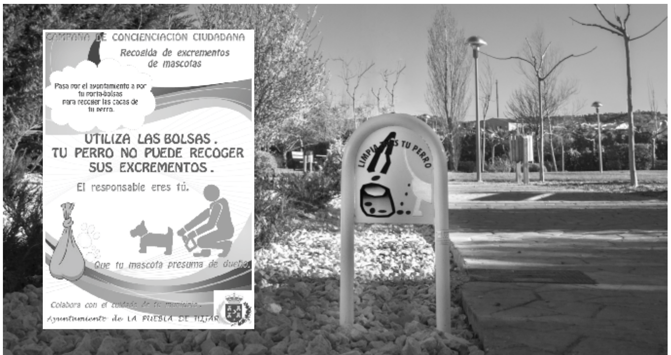
Campaña concienciación dueños de perros

Cementerio. Se coloca una plaza de parking para minusválidos en la zona de San Valero, que está siendo respetada.