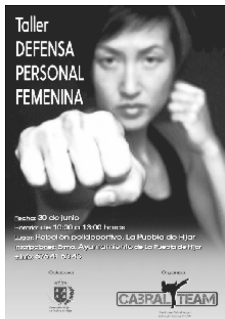
Taller defensa personal femenina