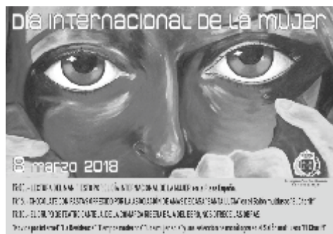
Día Internacional de la Mujer