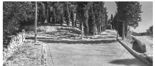
Pavimentación cuesta Ermita

Pavimentación cuesta Ermita. Realizado a cargo de fondos FIMS de DPT y fondos propios por un total aproximado de 18.000 €. Se ha pavimentado la cuesta y el inicio de los ramales vecinos. Como bordillo se ha reutilizado piedra recuperada de otras calles dando un aspecto más antiguo. Se ha ejecutado algún tramo de acera con suelo de piedra y en la zona de la explanada superior se ha puesto una valla de madera a modo de mirador.