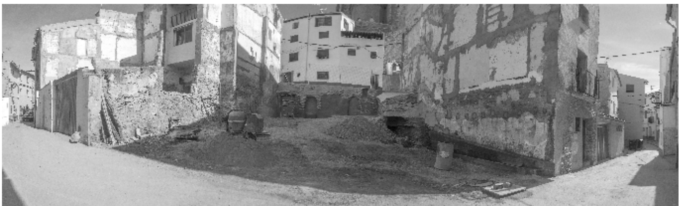
Saneamiento Casco Viejo. Calle Virgen de Arcos

mento de la antigua pista de vóley, rehabilitando también desagües, y realizado una rampa y ampliación de acera para mejorar la accesibilidad al Centro. Se colocó una valla entre pistas y se ha reforzado el vallado perimetral. En la 2ª aula de infantil ha sido preciso, por necesidades legales, realizar un nuevo baño completo en su interior y se ha aprovechado para instalar un suelo técnico adecuado. En los baños de arriba se han colocado sanitarios tamaño mini y renovado los marcos de puerta en todos los de abajo. El coste aproximado de todas estas intervenciones ha sido de 35.000 € y ha contado con subvención FIMS y otra de colegios DPT/DGA.