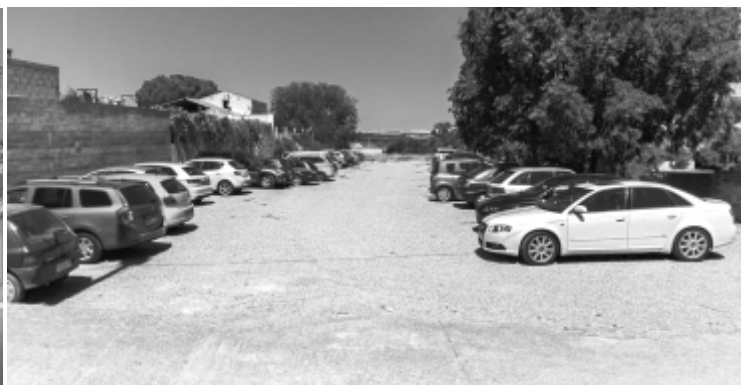
Parking del Charif