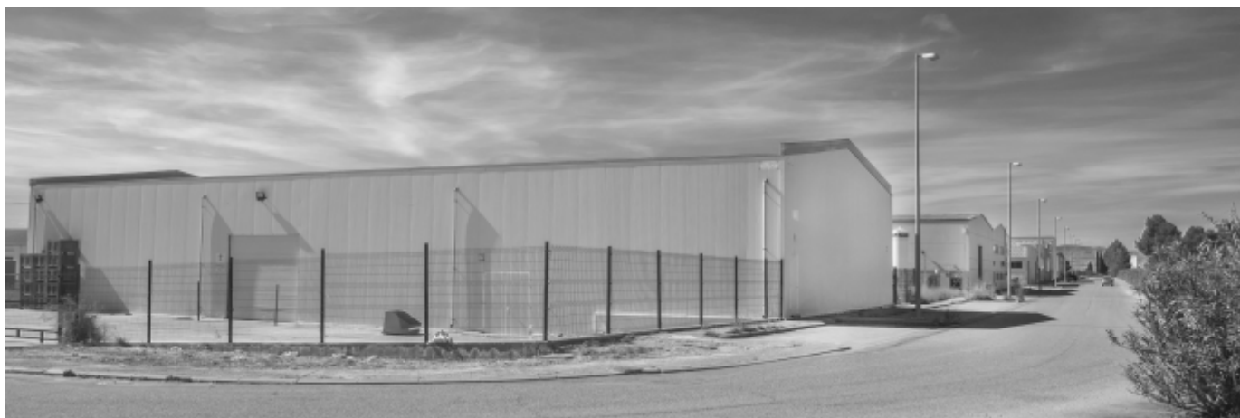
Nave vivero empresarial

Otros proyectos empresariales. Áridos Artal está estudiando la posible implantación de un centro de reciclado de residuos de obra. También se ha presentado documentación para la instalación en los terrenos de la Azucarera de una empresa dedicada a la selección y tostado de almendras y otros frutos secos. Por otra parte, la antigua PIBASA, ha sido adquirida por un grupo empresarial denominado Gonca Oil para poder usar las instalaciones o parte de ellas.