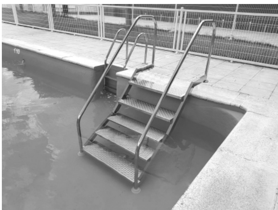
Piscinas. Acceso fácil