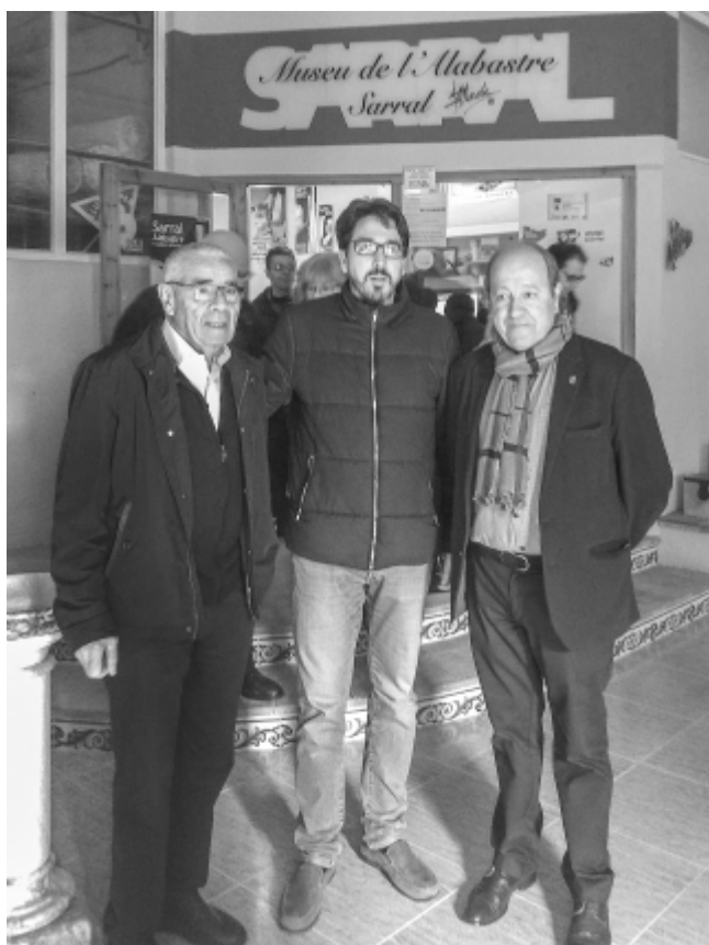
Clausura año del Alabastro Sarral

Desarrollo del alabastro. ADIBAMA ha aceptado recientemente subvencionar al Ayuntamiento de La Puebla con una especie de segunda parte del proyecto ejecutado el año anterior. Se sigue investigando la capacidad del alabastro como neutralizador de purines. Es un proyecto tecnológico de investigación denominado "Alternativas sostenibles con alabastro" que supondrá 47.000 € de los que vendrá subvencionado el 80%. El proyecto va de la mano con Exportadora Turodense y colabora la Universidad de Zaragoza. Recientemente se visitó, junto a estas dos entidades, el Departamento de Agricultura del Gobierno de Aragón para profundizar en posibles salidas a este proyecto I+D+I.