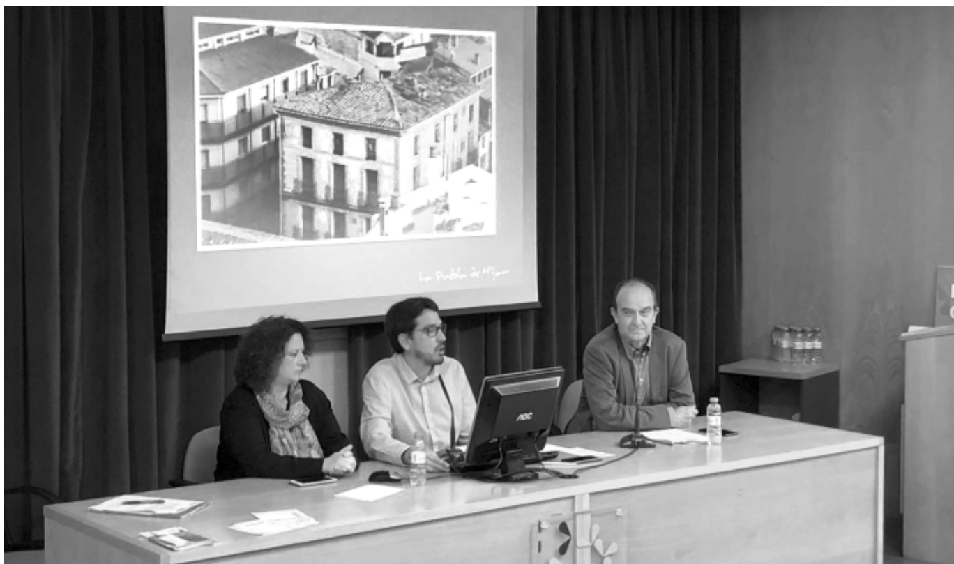
Conferencia Facultad Sociales - Proyecto Plaza de España

Accesibilidad. Se han llevado a cabo 3 proyectos interesantes y muy necesarios en forma de rampas de acceso a instalaciones municipales importantes como Colegio, Ayuntamiento y