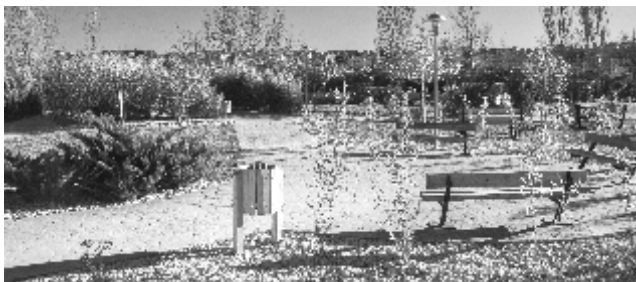
Última isleta parque nuevo

Última isleta parque nuevo. El proyecto original del parque nuevo de la Alameda ya está concluido. En 2018 se ha terminado la última isleta gran-