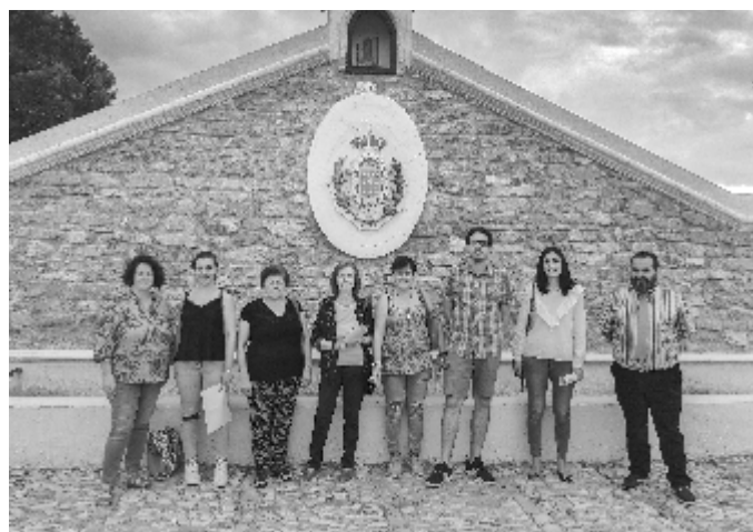
Ayudas sociales para ONG´s