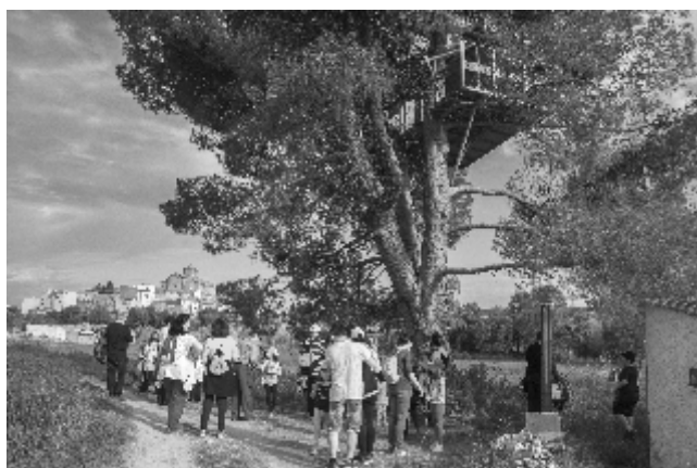
Primavera Cultural. Cañarte