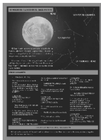
Noche en blanco