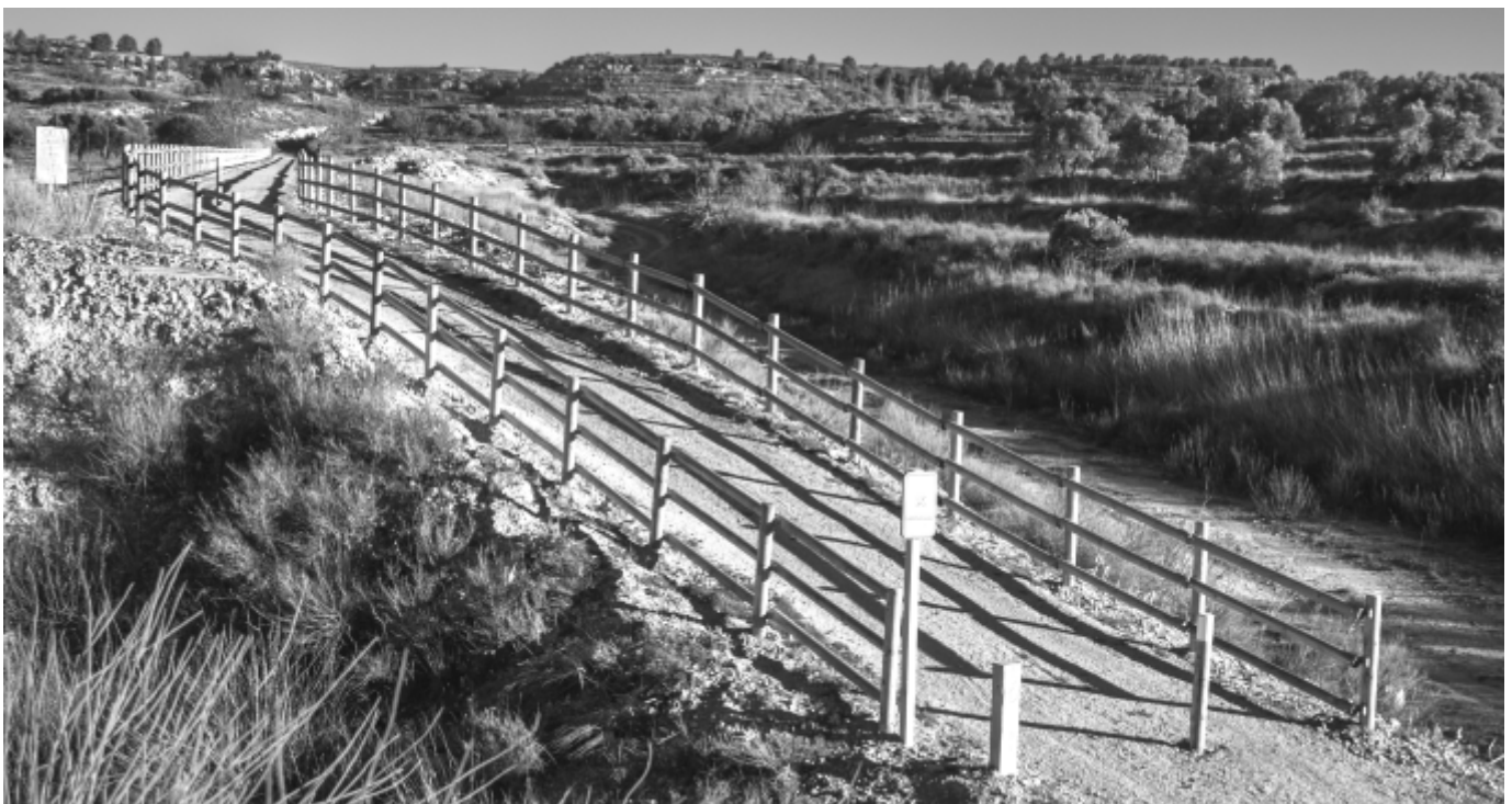
Vía Verde, vallado y señalización

Puentes y caminos. Tras un año en que hubo innumerables puentes reparados, éste ha sido más tranquilo, con mejoras puntuales en puentes o caminos. Las decisiones sobre prioridades se han tomado de acuerdo con el Sindicato de Riegos. Esperamos ansiosos poder contar con las máquinas de Diputación Provincial que, tras