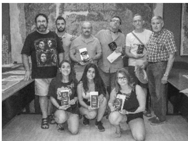
III Concurso de Pintura Rápida. Ganadores y Patrocinador