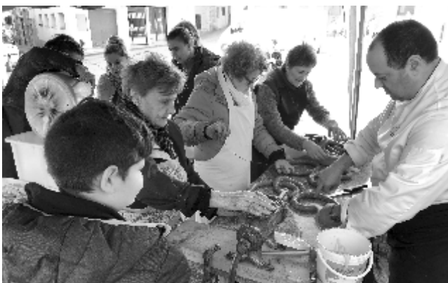
Semana Cultural. Mondongo tradicional