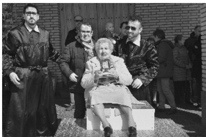
Homenaje por sus 100 años

Grupos de Tambores. - Las pasadas Jornadas Nacionales se realizaron en Mula (Murcia) y las Jornadas de la Ruta, en Alcorisa. El Grupo actuó en la tradicional Exaltación del Domingo de Ramos en La Puebla. El Juvenil nos representó en la Exaltación de Albalate y en la local. La Escuela Infantil de Tambor estuvo este curso dirigida por personas voluntarias del grupo adulto. La Coronación de Espinas realizó este año, además de La Puebla, sus habituales salidas por tierras aragonesas a Calatayud, La Puebla de Alfindén y Cadrete.