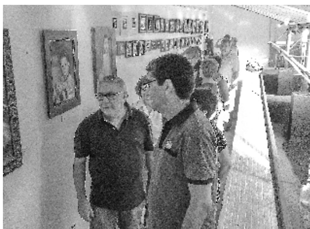
Exposición alumnos Taller de Pinura y Esmalte