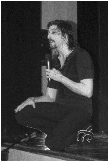
Jornadas Moriscas, Miguel Ángel Berna