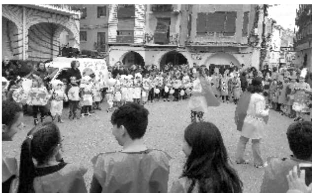
Invierno Cultural. Carnaval

Las novedades de este año 2018 fueron: En fiestas se contó con una carpa para las orquestas colocada al final del solar del antiguo casino, se fabricó la parte del vallado de vacas que antes tapaba este edificio y se repartió con el bono un vaso especial para favorecer el reciclaje en fiestas. Una intensa lluvia deslució el ambiente de una noche, pero, en general, funcionaron bien actos tradicionales y recientes. El espectáculo flamenco de tardes volvió a encandilar, esta vez con la presencia de la poblana Nuria Iglesias dentro del espectáculo Almendra Garrapiñá.