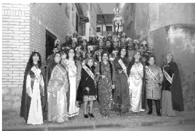
Homenaje a las reinas de Alabarderos

en valor la riqueza cultural que posee el toque de tambor y bombo en España"